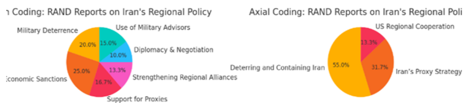
تصویر ۲. آنالیز نتایج کدها

در این جا دو نمودار دایره‌ای وجود دارد که نتایج تحلیل کدها را نشان می‌دهد: الف) کدگذاری باز: نمودار سمت چپ، توزیع کدهای اولیه شناسایی شده از گزارش‌های رند پیرامون سیاست منطقه‌ای ایران را نشان می‌دهد و بیشترین فراوانی مربوط به تحریم‌های اقتصادی (۱۵ مورد)، پس از آن بازدارندگی نظامی (۱۲ مورد) و در نهایت حمایت از مخالفین (۱۰ مورد) است. الف) کدگذاری باز: نمودار سمت راست گروه‌بندی این کدهای اولیه را در موضوعات اصلی نشان می‌دهد. بازدارندگی و مهار ایران متداول‌ترین موضوع (۳۳ مورد) و پس از آن استراتژی نیابتی ایران (۱۹ مورد) و همکاری منطقه‌ای ایالات متحده (۸ مورد) است از عوامل دیگر می‌توان به راهبرد نرم و رسانه‌ای اشاره کرد. این تجسم‌ها عوامل استراتژیک شناسایی شده در گزارش‌های اندیشکده RAND را با استفاده از رویکرد تحلیل کیفی کوربین و اشتراوس خلاصه می‌کنند.