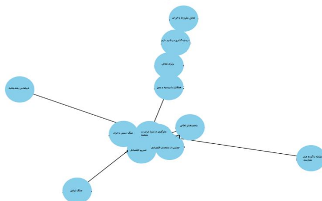
تصویر-۳. ارتباط بین گراف کدهای راهبرد اندیشکده رند

اندیشکده رند از یک شبکه راهبردی منسجم استفاده می‌کند که در آن ابزارهای مختلف، به‌صورت هم‌پوشانی و مکمل یک‌دیگر عمل می‌کنند. این گراف نشان می‌دهد که چگونه تحریم‌ها به‌عنوان محور اصلی، سایر راهبردها را تغذیه می‌کند، و جنگ رسانه‌ای و دیپلماسی مشروط نیز به‌طور هم‌زمان برای انزوای ایران عمل می‌کنند. سرمایه‌گذاری در قدرت نرم و حمایت از متحدان منطقه‌ای، به‌منظور مقابله با نفوذ ایران در منطقه و جلوگیری از ائتلاف‌های استراتژیک آن با قدرت‌های جهانی طراحی شده است.