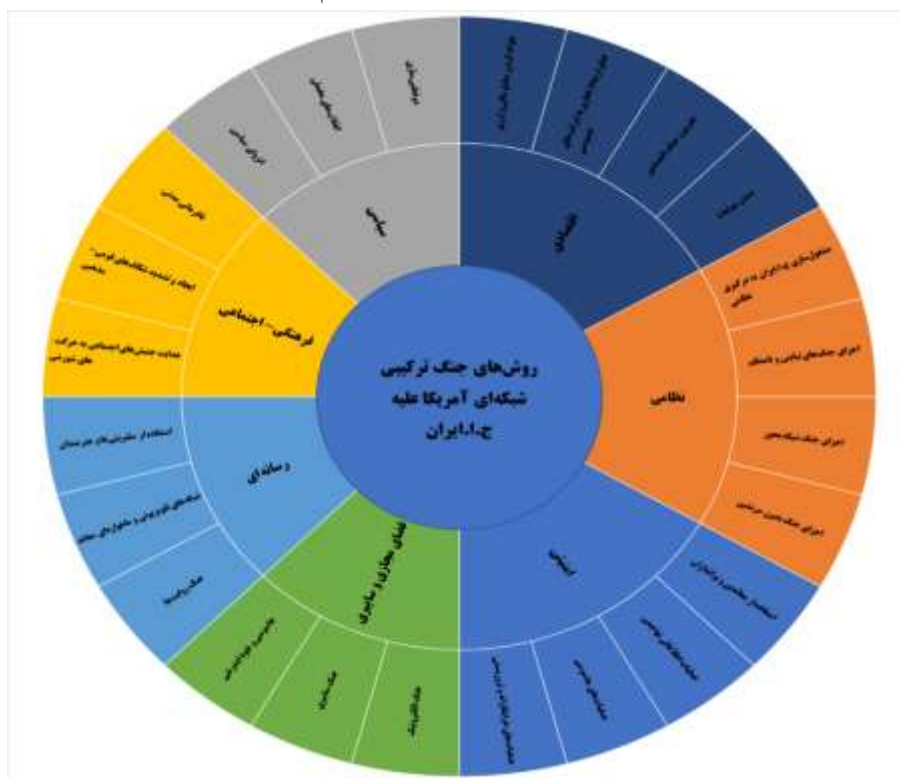
شکل شماره ۳: روش‌های جنگ ترکیبی شبکه‌ای آمریکا علیه ج.ا.ایران

جهت منزوی ساختن ایران و... مؤید آن است که روش تهدیدات امنیتی ایران به سمت ترکیبی شبکه‌ای پیش رفته است. بر اساس یافته‌های تحقیق در جدول شماره ۲ تعداد ۲۴ روش برای اجرای جنگ ترکیبی شبکه‌ای آمریکا علیه ج.ا.ایران در ۷ مؤلفه به ترتیب اولویت عبارت‌اند از: رسانه‌ای ۳ روش، امنیتی ۴ روش، اقتصادی ۴ روش، فرهنگی - اجتماعی ۳ روش، فضای مجازی و سایبری ۳ روش، نظامی ۴ روش و سیاسی ۳ روش است. روش رسانه‌ای در حد خوب مؤثر است، روش سیاسی در حد کم و روش‌های امنیتی - اقتصادی، فرهنگی - اجتماعی، فضای مجازی و سایبری و نظامی در حد متوسط در شکل‌گیری جنگ هیبریدی شبکه‌ای آمریکا علیه ج.ا.ایران مؤثر هستند. شایان ذکر است که برخی از روش‌هایی که در شکل زیر بیان شده است در شکل قبلی به‌عنوان عوامل شکل‌گیری در جنگ ترکیبی شبکه‌ای بیان شده است، به عبارتی دیگر برخی از عوامل جنگ ترکیبی شبکه‌ای همزمان به‌عنوان روش جنگ ترکیبی هم استفاده شده است.