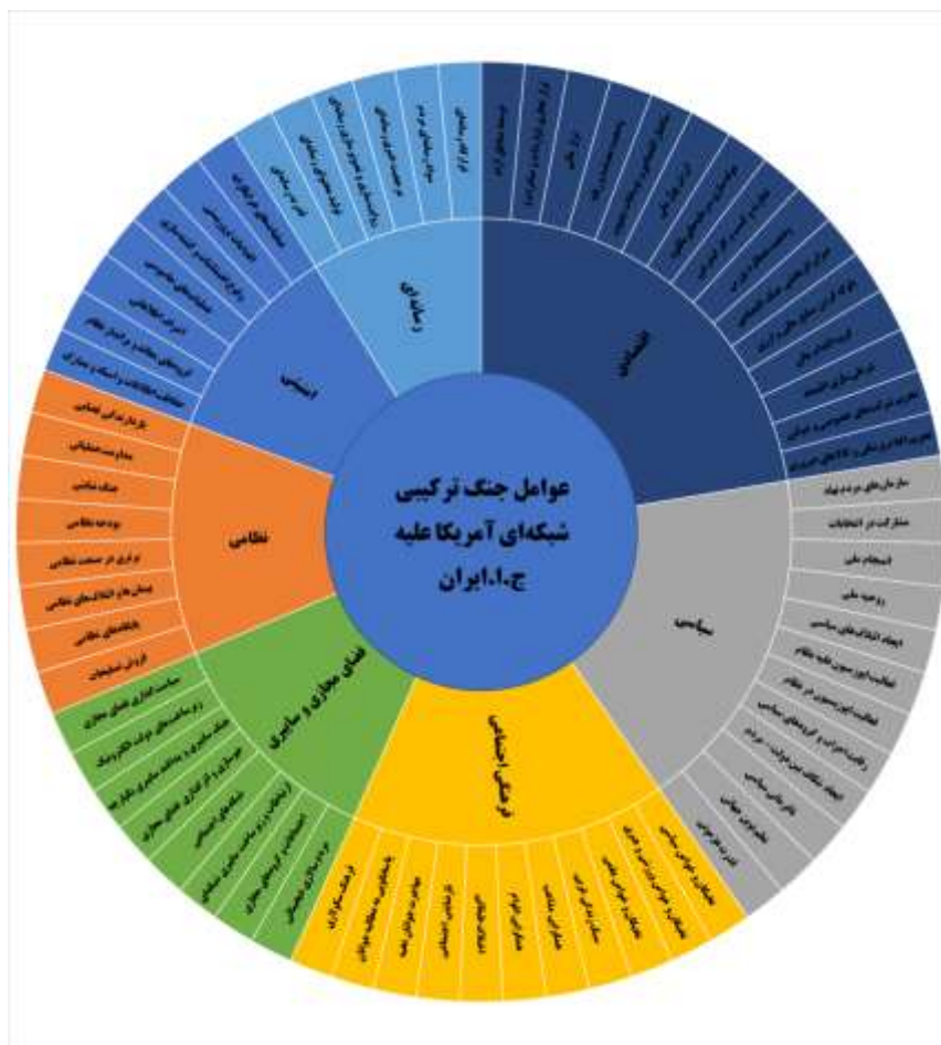
شکل شماره ۲. عوامل جنگ ترکیبی شبکه‌ای آمریکا علیه ج.ا.ایران

جنگ ترکیبی شبکه‌ای آمریکا با هدف بی‌ثبات سازی ج.ا.ایران و دوقطبی کردن جامعه، به روش‌های مختلف صورت می‌گیرد. آمریکا، ایدئولوژی و افکار عمومی مردم را هدف قرار داده و سعی می‌کند با جذب سیاستمداران یا سلبریتی‌های صاحب نفوذ، زمینه را برای نفوذ و بسترسازی در اذهان عمومی مهیا سازد.