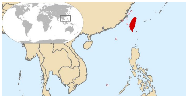
تصویر شماره ۱: موقعیت جزیره تایوان

از اوایل قرن بیستم تاکنون به‌ویژه از زمان روی کارآمدن حزب کمونیست در چین در سال ۱۹۴۹، جزیره تایوان کانون تنش در منطقه بوده است. این تنش‌ها، زمینه دخالت‌های متعدد ایالات متحده در منطقه و اتخاذ سیاست دوگانه در برابر تایوان و چین را فراهم کرده است (علی پور، ۱۳۹۲: ۱۴۲-۱۴۰). بعد از انقلاب کمونیستی ۱۹۴۹ و شکست ملی‌گرایان به رهبری چیانگ کایچک ۱ از کمونیست‌ها، جزیره فرمز ۲ در تایوان به محل اصلی حضور مخالفان ملی‌گرای دولت کمونیستی چین تبدیل شده است. از آن زمان پکن این جزیره را «استان طغیانگر» ۳ تلقی کرده که اگر لازم باشد باید با توسل به زور، به سرزمین اصلی ملحق شود. از طرفی حمایت‌های آمریکا از این جزیره و دولت خودمختار آن، همواره باعث تشدید تنش در این منطقه شده است. ملی‌گرایان چینی مستقر در تایوان خواهان استقرار یک نظام غیر کمونیستی در چین هستند و اعلام کرده‌اند تا پیش از تحقق این شرط، امکان وحدت با چین وجود ندارد. تایوان از سال ۱۹۴۹ تا ۱۹۷۱ و پیش از بهبود روابط چین با غرب، از جانب بسیاری از کشورها به رسمیت شناخته شد و حتی بر کرسی چین در سازمان ملل تکیه زد (Peterson, 2004: 28). اما پس از دستیابی چین به سلاح اتمی و همزمان با اتخاذ سیاست‌های معتدل توسط رهبران چین مانند جئوئن لای ۴ ؛ نخست‌وزیر مائو ۵ و سپس دستیارش دنک شیائوپینگ ۶ ، آمریکا سیاست موازنه‌سازی در برابر شوروی از طریق چین را در پیش گرفت.