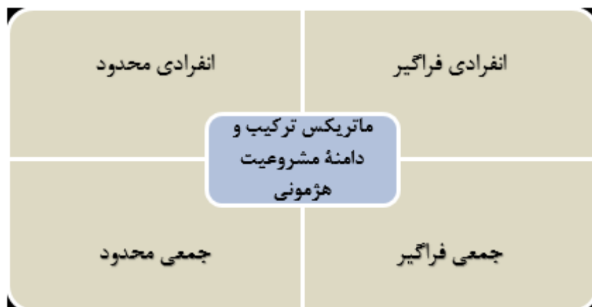
شکل ۳. اشکال چهارگانه هژمونی هوشمند (Clark, 2011: 61)

مطابق اشکال ارائه شده هژمونی هوشمند در وضعیت پیچیدگی ساختاری همزمان به صورت انفرادی یعنی دولت دارنده نقش هژمونی و همچنین به صورت جمعی یعنی دولت‌ها و کنش‌گران غیردولتی در داخل و خارج از شبکه تمدنی و هویتی هژمون وجود دارد. علاوه بر این دامنه مشروعیت و مقبولیت اجتماعی هژمونی هوشمند در شبکه ژئواستراتژیک اجتماعی همزمان به صورت محدود و فراگیر وجود دارد. بر این مبنا می‌توان گفت که هژمونی هوشمند در سیستم بین‌الملل نوین دارای ابعاد فراوان و پیچیدگی‌های قابل توجه است. این هژمونی به دلیل بالا بودن سطح نهادینگی همزمان به صورت انفرادی و جمعی در گستره ژئواستراتژیک اجتماعی سیستم بین‌الملل اعمال می‌شود. مشروعیت و مقبولیت اجتماعی هژمونی هوشمند نیز مانند ترکیب هژمونی به صورت محدود و فراگیر در گستره ژئواستراتژیک اجتماعی وجود دارد. زمانی که از مشروعیت و مقبولیت فراگیر هژمونی هوشمند بحث می‌شود منظور توانایی و افزایش سطح نفوذ گفتمان و مؤلفه‌های ارزشی و هنجاری هژمون در سایر گفتمان‌های تمدنی و هویتی است (Martin, 1997: 41). در رابطه با مشروعیت و مقبولیت محدود هژمونی هوشمند نیز باید گفت هژمونی در داخل شبکه تمدنی و هویتی خود میان بسیاری از کنش‌گران دولتی و غیردولتی دارای مشروعیت و مقبولیت است. بنابراین هژمونی هوشمند در روابط بین‌الملل به صورت همزمان به صورت انفرادی