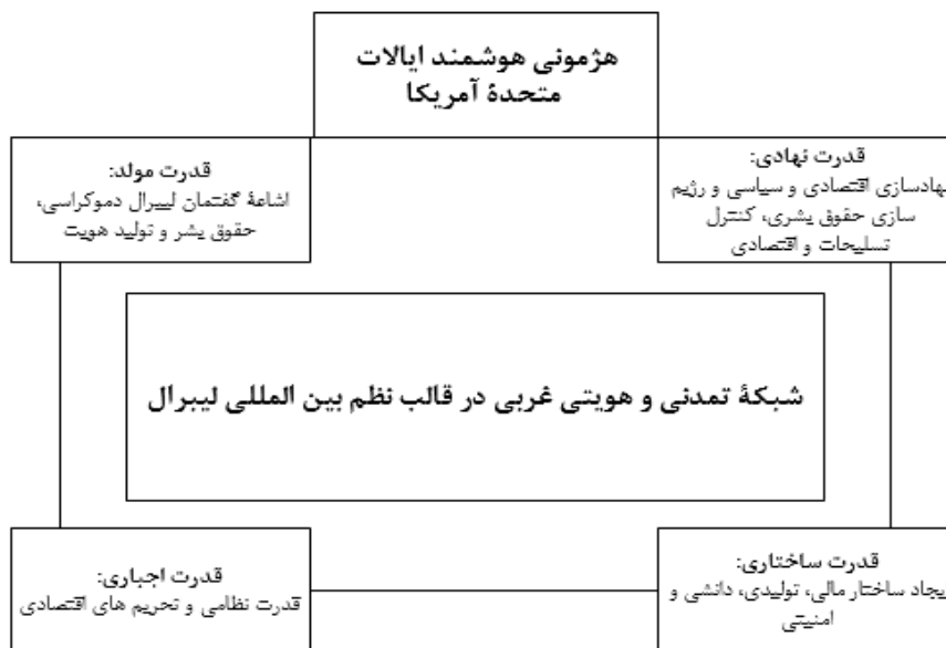
شکل ۴. هژمونی هوشمند آمریکا و نظم لیبرالی (آسیابان، ۱۴۰۱: ۱۵۹)